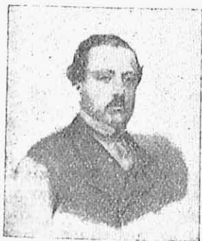
Ὁ Χαρίλαος Τρικούπης κατὰ τὸ 1866.

Ἡ ἰδέα αὐτὴ μιᾶς Ἑλληνοσερβικῆς συμμαχίας δὲν ἦτο ἄλλως τέ τι τὸ καινόν. Ἦδη τὸ 1861 ὁ ἐν Κωνσταντινουπόλει πρέσβυς τοῦ Ὄθωνος Μᾶρκος Ρενιέρης εἶχε λάβῃ ἀφορμὴν νὰ ὁμιλήσῃ διὰ μακρῶν περὶ τῶν γενικῶν ἀρχῶν, ἐφ' ὧν θὰ ἠδύνατο νὰ στηριχθῇ μία τοιαύτη συμμαχία, μετὰ τοῦ Γκαράσανιν, τοῦ ἔξοχωτέρου πολιτικοῦ ἀνδρὸς τῆς Ἡγεμονίας, ὅστις εὗρίσκετο τότε εἰς τὴν Τουρκικὴν πρωτεύουσαν διὰ νὰ λύσῃ διάφορα ἐκκρεμοῦντα μεταξὺ