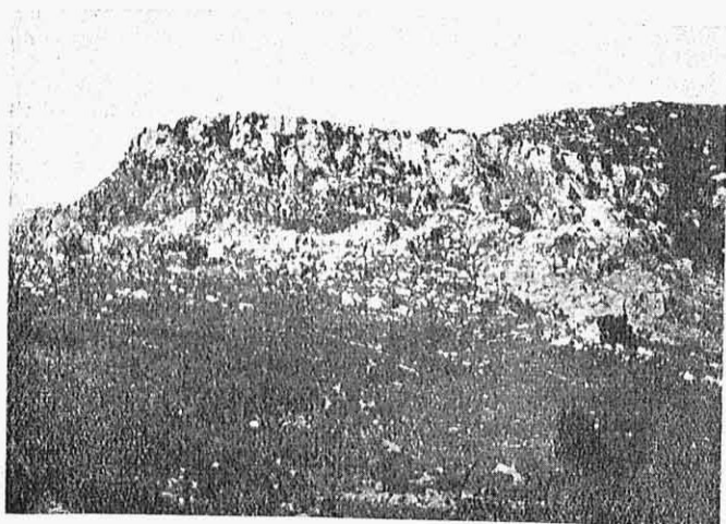
Εικ. 2.— Τὸ Ζάλογο ὅπως φαίνεται ἀπὸ τὴν Κασσώπη.

Στὴ βορεινὴ τὴν πλάτη τὸν Παλιορόφορο, τὸ Σέσοβο, πὸν πῆρε τὸ νέο ὄνομα Πολύβρυσσο καὶ τὰ Δούβιανα (Κρουπηγή). Ἀπ' τοῦ νοτιᾶ τὸ μέρος κρατεῖ τὴν ἡρωϊκὴ τὴν Καμαρίνα πὸν τὴ δόξασε ἡ ἐπανάστασι τῆς στὰ 1897.