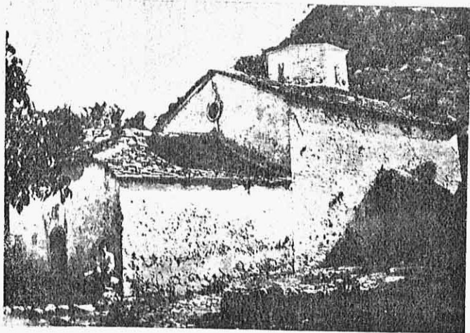
Εἰκ. 4.— Ἡ ἐκκλησιὰ τοῦ Ζαλόγου.

Πρῶτος ἠγούμενος τοῦ μοναστηριοῦ γράφεται στὴν