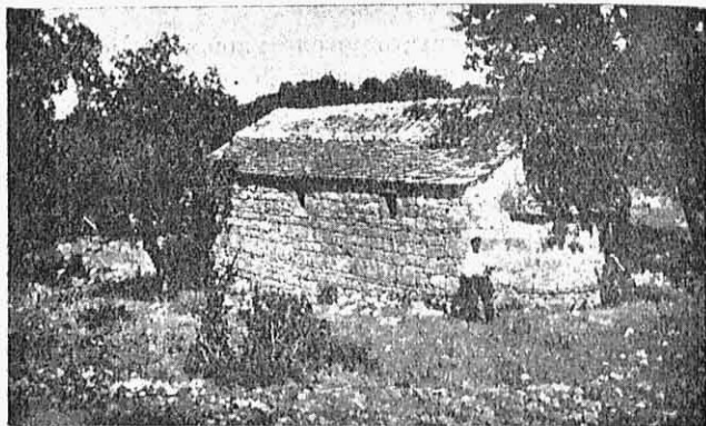
Εικ. 6.— Τὸ παλιὸ μοναστήρι, ὁ Ἁγ. Ταξιάρχης.

Τὸ εἰκονοστάσι του εἶναι ξυλένιο, ἀπλό. Ὡστόσο ἡ Ἁγία