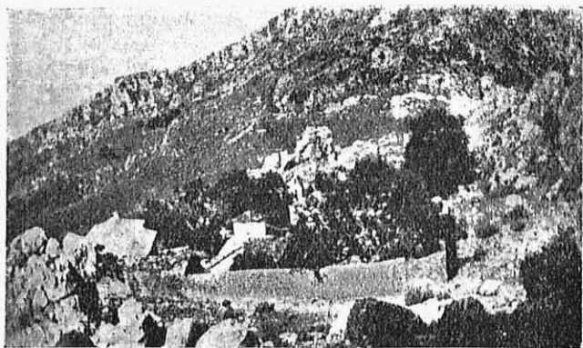
Εἰκ. 5.— Τὸ μοναστήρι ἀπὸ μακρὰ.

Βορεινὰ καὶ νότια ἀπ' τὸ μοναστήρι κι εὐτὺς ἔξω ἀπ' τὰ κελλιά ἀνάμεσα στὶς πέτρες ξεχωρίζουν ρειποθέμελα σπι- τιῶν τὸ ἕνα κοντὰ στὸ ἄλλο. Καρυὲς λέγεται τὸ βορεινὸ τὸ μέρος, τὸ νότιο δὲν ἔχει ὄνομα. Ἡ προφορικὴ παράδοση