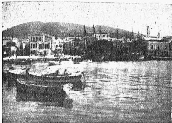
Εἰκ. 1.— Τὸ λιμάνι τῆς Τήνου.

Ψηλά, στήν κορφή τῆς χώρας, σὲ μέρος ἀγναντερό, ἡ ἐκκλησία τῶν ἐκκλησιῶν τοῦ νησιοῦ, ὁ «καλλιμάρμαρος ναὸς τῆς Εὐαγγελιστρίας» τρογυρισμένος ἀπὸ τὰ χτίρια τοῦ «ἱεροῦ καθιδρύματος» κελιά, βεράντες, σκάλες, «θησαυ- ροφυλάκειον» «μουσικὴ σχολή», «γραμματεία», «αἴθουσα