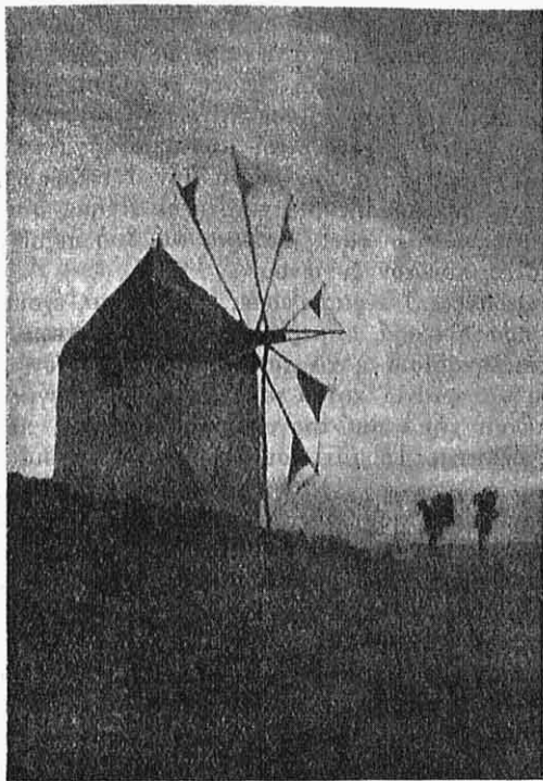
Εἰκ. 3.—Ἐὐὐ Ἄνεμόμυλος.

Ἐὐὐ ἄνθρωπος ἔγινε χαρούμενος, φαίνονταν εὐτυχισμένος