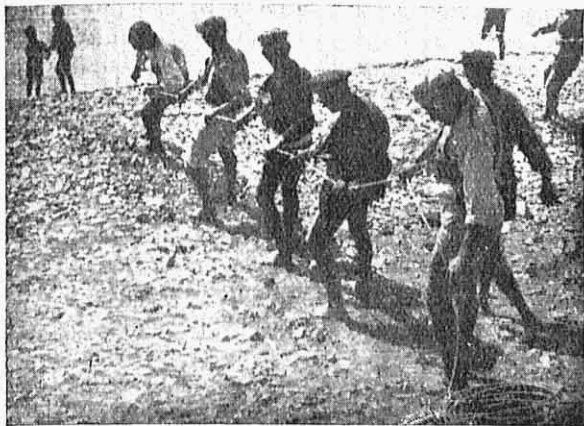
Εἰκ. 5.— Τρατάρηδες στὴν «Ἀγκάλῃ».

γιαλὸ γιαλὸ κατὰ τὰ δυτικά, σὲ κάποιο ξωκκλήσι. Οἱ τρατολόγοι, μὲ ἀναμιαζωμένα τὰ παντελόνια, τραβᾶνε τὴν ἀτέλειωτη τριχιά, σέρνουν μὲ ὄλη τους τὴ δύναμη ἀντιστυλῶνοντας τὰ πόδια στὰ βότσαλα. Οἱ γλάροι πετᾶνε ξυστὰ στὴν ἀπανωσιὰ τῆς θάλασσας. Κάμποσα παιδάκια, ἐκεῖ κοντὰ στοὺς τρατολόγους, καρτεροῦνε τὸ μεράδι τους, κἀνα ψαράκι πὺ θὰ πέσει ὅταν θ' ἀδειάζουν τὸ δίχτυ. Στὴν «Ἀγκάλῃ» κἀνανε πολλοὶ μπάνιο, πῆγα κι ἐγὼ καὶ κολύμι-