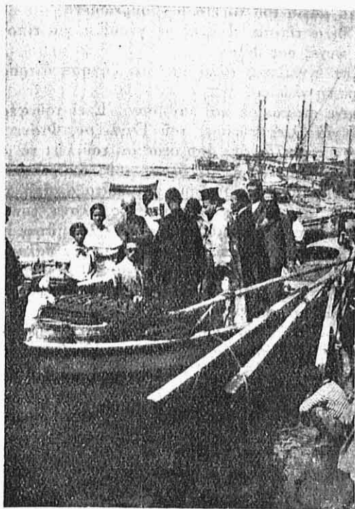
Εἰκ. 4.— Ἄγισμος διστυῶν στὴν Τήνο.

Ὁ καπετάνιος μας βαρὺς, κατσοφιασμένος, τὸν περιμένε