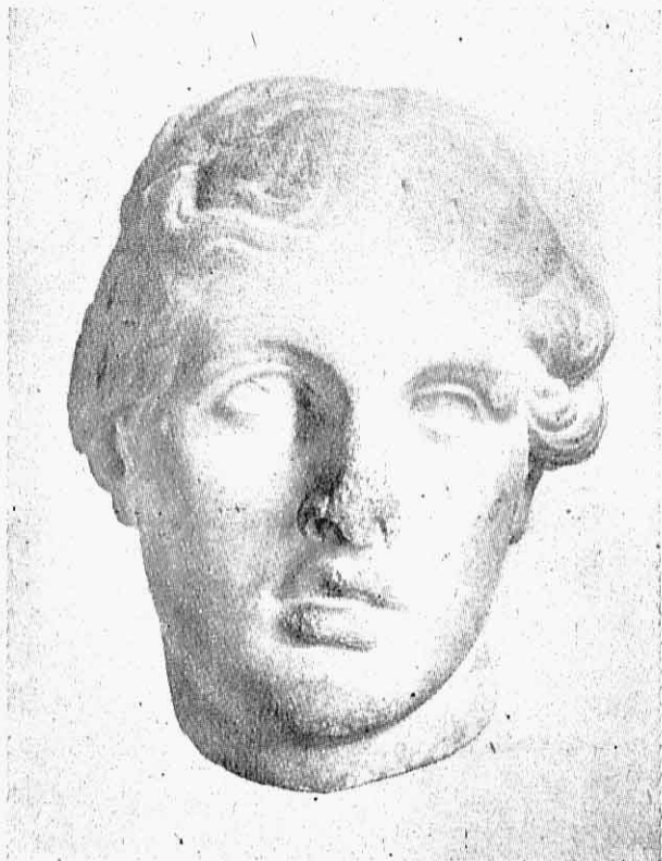
5. — Κεφαλή γυναικὸς ἐκ Περγάμου.

Ὁ ὀφθαλμὸς φαίνεται ὡς ἕλαφρά τις πνοή, τὰ βλέφαρα συγγέονται πρὸς τὸν βολβόν, τὸ δὲ σύνολον δηλοῦται