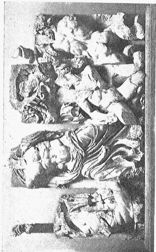
4. — Σύμπλεγμα Διός Κεραινοῦ μαχομένου κατὰ τοῦ Γίγαντος Πορφυριῶνος καὶ ἄλλων Γιγάντων.