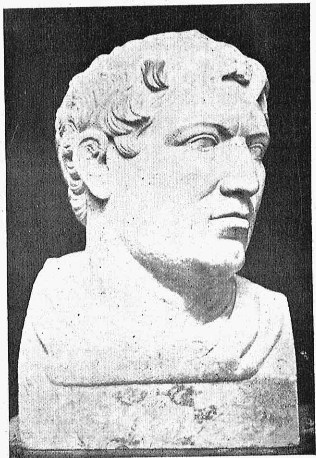
1. — Προτομή Φιλεταίου ἐν Νεαπόλει.

εἶχεν ἔξαιρετικὴν σημασίαν ἢ δημιουργία διαμέσου τινὸς κρατιδίου μεταξύ τῆς Συρίας καὶ τῆς Θοράκης καὶ ἐναντίον