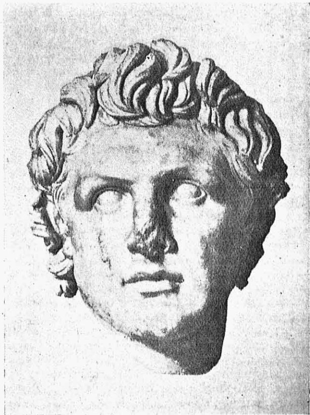
2.—Κεφαλὴ Ἀττάλου Α' ἐν Βερολίῳ.

εἶναι ἀξία πάσης προσοχῆς οὐχὶ μόνον εἰς τὰς σχέσεις αὐτοῦ καὶ τὰς συμμαχίας πρὸς τοὺς γειτονικοὺς δυνάστας, ἀλλὰ