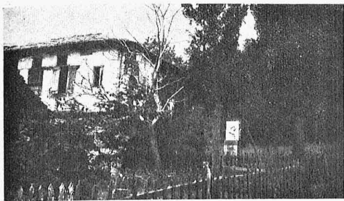
Τὸ σχολεῖον τοῦ Ρήγα.

Τὸ θεωροῦν χρέος τους στὸν Ἅγιο ἀλλὰ καὶ μέσον καμμιά φορά νὰ ζητήσουν κάποια χάρη ἀπὸ τὸν Ὑψιστον. Ἔτσι, χωρὶς τὴ μεσολάβηση τοῦ παπᾶ, αἰσθάνονται περισσότερη οἰκειότητα μὲ τὸ θεῖον. Ἐξομολογοῦνται κάποτε στὴν εἰκόνα καὶ τὰ βάσανά τους, πὸν δὲν λείπουν ποτέ. Πάντα βασανισμένες, πάντα μὲ βαρεῖες δουλειές οἱ γυναῖκες οἱ Ζαγορια-