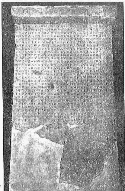
Εἰκ. 3. — Ἐλευσινιακὴ ἐπιγραφὴ. Συμβόλιον κατασκευῆς πόλων καὶ ἐμπολίων τῶν Κιώνων τῆς στοᾶς τοῦ Φίλωνος.

ρεάν σύνθεσιν τῶν σφονδύλων τῶν κιώνων, εἰς τὸν ἐργολάβον Βλεπαῖον υἱὸν τοῦ Σωκλέους ἀπὸ τὸν δῆμον Λαμπρέων. Ἡ ἐπιγραφὴ αὕτη εἶνε πολὺ χαρακτηριστικὴ διὰ