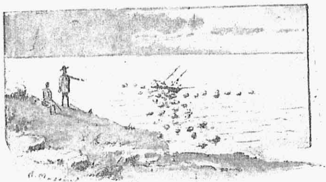
Εἰκ. 2.—Τὸ καϊκι εἰς τοὺς βράχους.

Μὲ ἀπλωμένα τὰ κατάλευκα πανιά ὡς μεγαλοπρεπῆς κύκνος ἠυλάκωνε τὴν θάλασσαν καὶ ὑπερήφανον εἰσήρχετο εἰς τὸν λιμένα. Μὲ βλέμμα περιέργον τὸ παρηκολούθησα μέχρι τῆς στιγμῆς ποὺ ἠκούσθη ὁ παρατεταμένος ἦχος τῆς ἀλύσεως καὶ ἡ ἀγκυρα σιγὰ σιγὰ βυθίζομένη εἰς τὴν θάλασ-