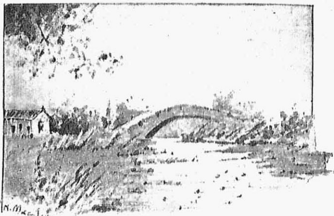
Εἰκ. 3.—Παναγία ἢ Καρτελιώτισσα.

Ἐνας ναυτικὸς ἐκάθητο πλησίον μου. Τὸν ἐρωτῶ :