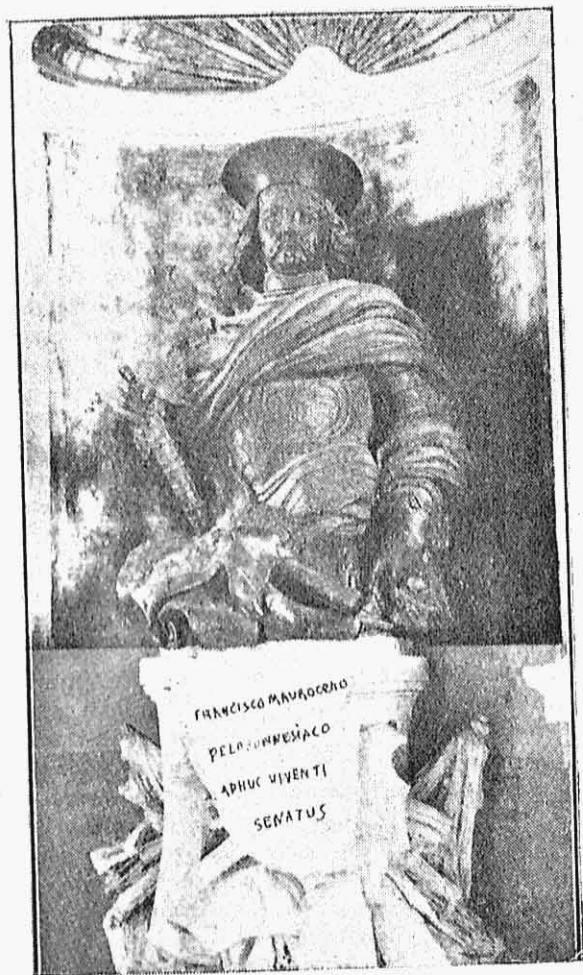
Φραγκίσκος Μοροζίνης. Με τὴ στολὴ τοῦ Γενικοῦ Καπετάνου.