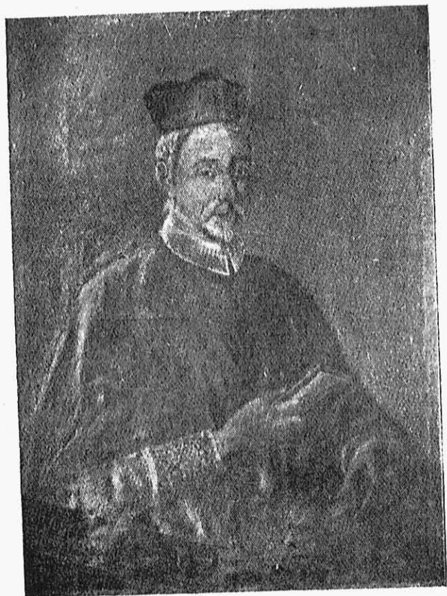
Μάρκ' Ἀντώνιος Βαρβαρῆγος.