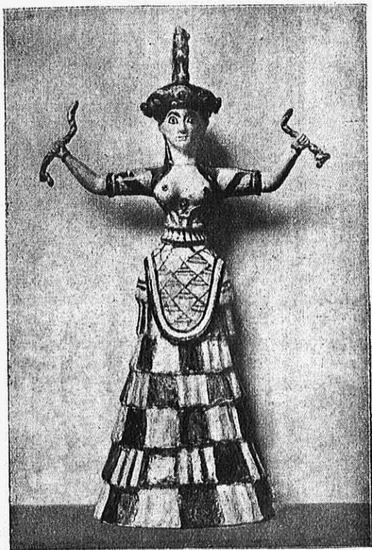
Εἰκ. 3. — Ἱέρεια Μινωϊκῆς λατρείας.

ἐποχῆς, δηλ. χιλιάδας ἐτῶν πρότερον τὰ πήλινα στεατοπυ- γικά εἰδώλια εἰκονίζουσι πιθανώτατα θήλειαν θεότητα, ἢ