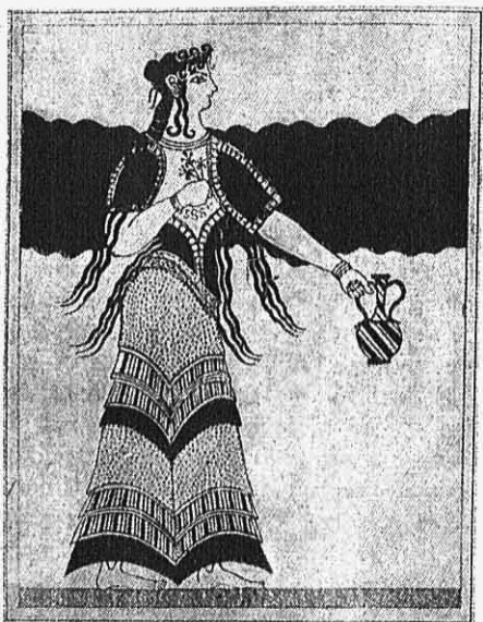
Εἰκ. 6. — Κυρία ἐκ τοῦ Καδμείου.

Ἰδιαίτερον εἶδος ἐνδυμασίας φέρουσιν οἱ ἄνδρες καὶ αἱ