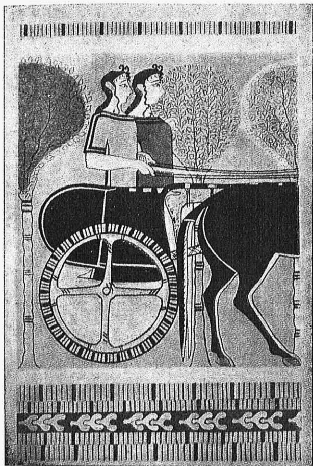
Εικ. 5. — Κυρία Τιτυνθός ἄρματοδρομοῦσαι.