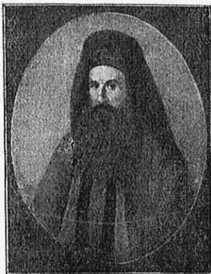
Ὁ Π. Πατρῶν Γερμανός

μοῦ, ἡγεῖτο οὐ μόνον τῶν στρατιωτικῶν ἐπιχειρήσεων, ἀλλὰ διεδραμάτισε σπουδαιότατον πρόσωπον καὶ εἰς πάντα τὰ ἐσωτερικὰ ζητήματα τῆς ἐποχῆς, ἐργασθεὶς ὅσον οὐδεὶς ἄλλος ὑπὲρ τῆς τακτοποιήσεως τῶν πραγμάτων καὶ τῆς εἰρηνεύσεως τῶν ἀντιμαχομένων, καθόσον κατενόει πληρέστατα τοὺς μεγίστους κινδύνους, τοὺς ὁποίους συνεπήγοντο διὰ τὸ ἀγωνιζόμενον Ἕθνος αἱ ἐσωτερικαὶ ἀνωμαλίας καὶ αἱ ἔριδες, καὶ ὀρθῶς ἀντελαμβάνετο ὅτι ἐκ τῶν κυριωτέρων καθηκόντων τοῦ κληρικῶ εἶναι νὰ συντελῇ εἰς κατασίγησιν τῶν παθῶν καὶ τῆς διχονοίας, ἣτις παρέλνε τὰς δυνάμεις τοῦ Ἕθνους. Ὡς ἐκφριστικώτατα ἔγραψεν ὁ Γερμανός, ἐν σωζομένη ἐπιστολῇ του: «εἶναι ἀναγκαῖον νὰ βληθῇ μία τάξις καλὴ καὶ εἰς τὸ πολιτικὸν καὶ εἰς τὸ στρατιωτικόν, καὶ ἀμοιβαίως αὐτὰ τὰ δύο σώματα νὰ συνυπακούωνται μὲ καλὴν ἀρμονίαν, καὶ νὰ μὴ μένη τὸ ἐσωτερικὸν τῆς Πατρίδος ἀκατάστατον καὶ ξεσχισμένον· ἐπειδὴ τίποτε δὲν μᾶς ὠφελοῦν αἱ νίκαι καὶ τὰ κάστρα, εἴν δὲν θεμελιώσωμεν τὰ ἐπιχειρήματά μας εἰς μίαν νόμιμον καὶ εὐτακτον κυβέρνησιν τοῦ πολιτικοῦ καὶ στρατιωτικοῦ καὶ εἴν δὲν ἀπορρίψουν ὅλοι τὰ ἴδια συμφέροντα καὶ προτιμήσωσι τὸ κοινὸν συμφέρον τῆς Πατρίδος . . . εἰ δὲ καὶ τὸ ἐσωτερικὸν μας τρέχη ἀκατάστατον καὶ σπαράττεται ἀπὸ τοὺς σκοποὺς καὶ τὰ τέλη ἑνὸς ἐκάστου, τότε καὶ ὅλη ἡ Εὐρώπη ἂν μᾶς βοηθῇ τίποτε δὲν μᾶς ὠφελεῖ. . . Δὲν βλέπω τίνι τρόπῳ δύναται νὰ προοδεύσῃ τὸ Ἕθνος μὲ τοιοῦτο τερατῶδες ἐσωτερικόν».