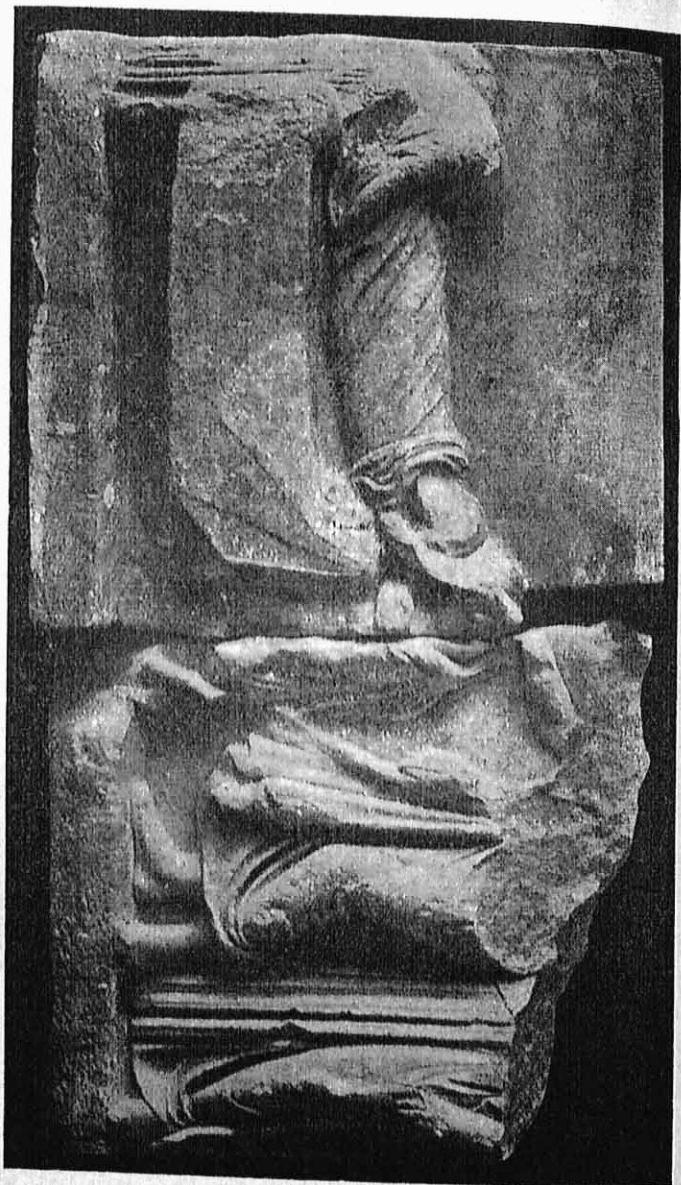
Εικ. 8. — Ἄνεργιστος ἐκ τοῦ Ἀσκληπείου Ἀθηνῶν, εἰκονίζον ἐγκοιμήσαν.