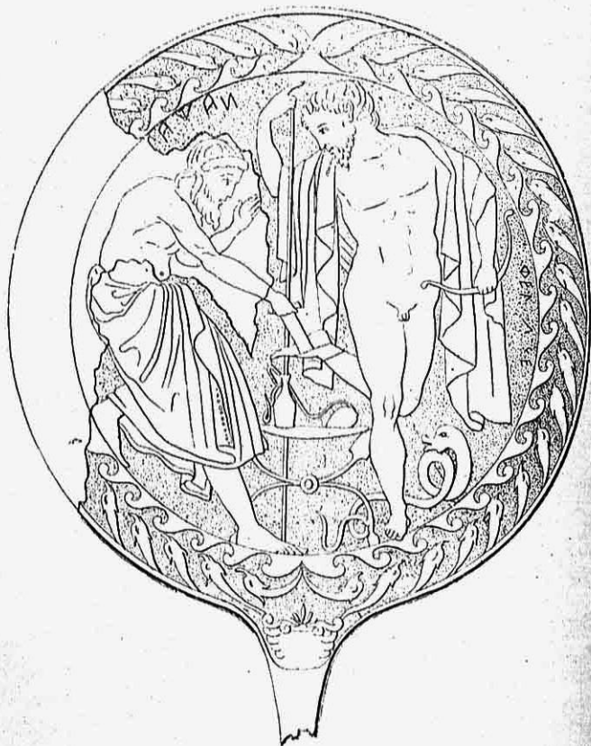
Εικ. 3. — Εἰκὼν χαρακτῆ ἐπὶ χαλκοῦ ἑτρουσκικοῦ κατόπτρου. Ὁ Μαχάων ἐπιδέχει τὸν πόδα τοῦ Φιλοκτήτου.

τῆς κατασκευῆς τοῦ ἀγγείου κυμαίνεται περὶ τὸ 480 π. Χ. Ἐπαγγελματικωτέραν ἰατρικὴν δεικνύει κάτοπτρόν τι