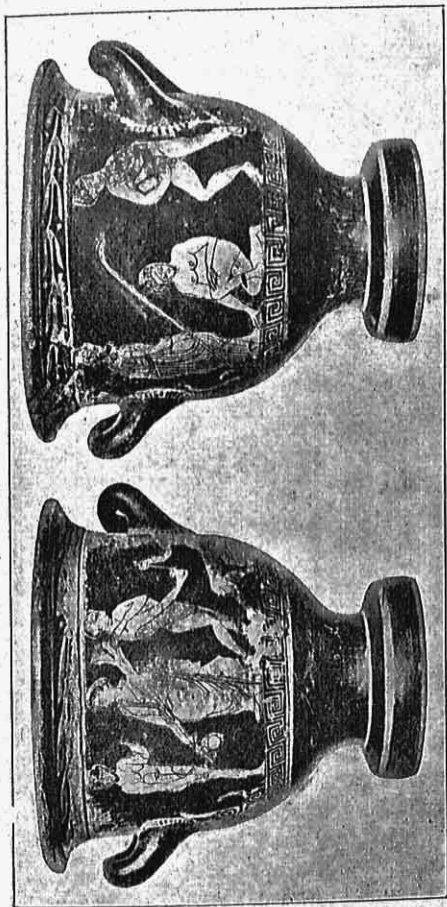
Εικ. 6. — Ήρωιδόμορφος κατήρη τοῦ Ἐθνικοῦ Μουσείου τῶν Ἀθηνῶν.