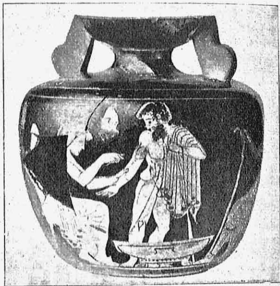
· Εἰκ. 4. — Ἀρύβαλλος ἐρυθρόμορφος ἀττικῆς ἐργασίας.

Ἐπὶ τοῦ ὤμου περίξ τοῦ στομίου εἰκονίζονται δύο Ἑρω- τες πετόμενοι. Ἡ κόμη αὐτῶν ὑποτίθεται ξανθή, ἐπειδὴ εἶνε διὰ γανώματος ἀραιοῦ εἰκονισμένη, τὸ ὁποῖον διὰ τῆς πυρᾶς