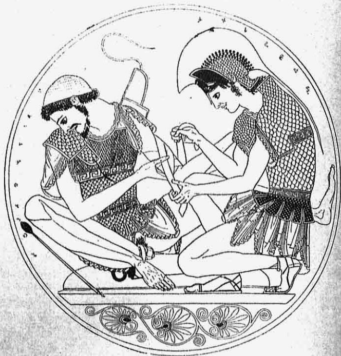
Εἰκ. 2.—Εἰκὼν κύλικος τοῦ Σωσίου. Ὁ Ἀχιλλεὺς ἐπιδένει τραῦμα τοῦ Πάτροκλου.

χρῶμα τοῦ πηλοῦ ἔχουσῶν τῶν πρότερον σχεδιασθεισῶν μορφῶν. Ἡ ἔξω πλευρά του εἰκονίζει τὴν ὑποδοχὴν τοῦ Ἡρακλέους ὑπὸ τῶν θεῶν ἐπὶ τοῦ Ὀλύμπου. Ἀλλὰ ἐπὶ τῆς ἐντὸς ἐπιφανείας τοῦ ἀγγείου ὁ κεντρικὸς κυκλικὸς χώρος