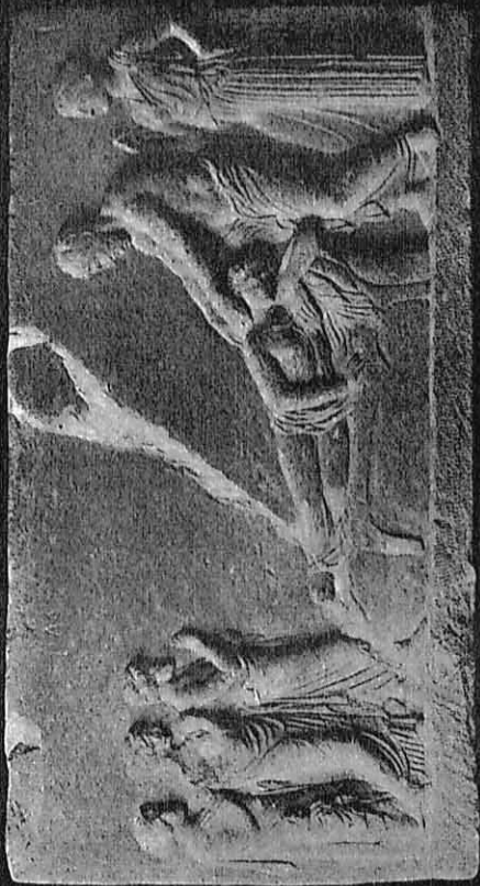
Εἰκ. 10. — Ἀνάγλυφον ἀναθηματικὸν ἐκ τοῦ Ἀσκληπείου τῆς Μουναίας τοῦ Πειραιῶς (ἐν τῷ μουσεῖῳ τοῦ Πειραιῶς νῦν).