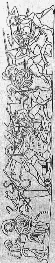
Εἰκ. 1. — Εἰκὼν Χαλκιδικοῦ ἀγγείου. Μάχη περὶ τὸ πτώμα τοῦ Ἀγλήλεως.