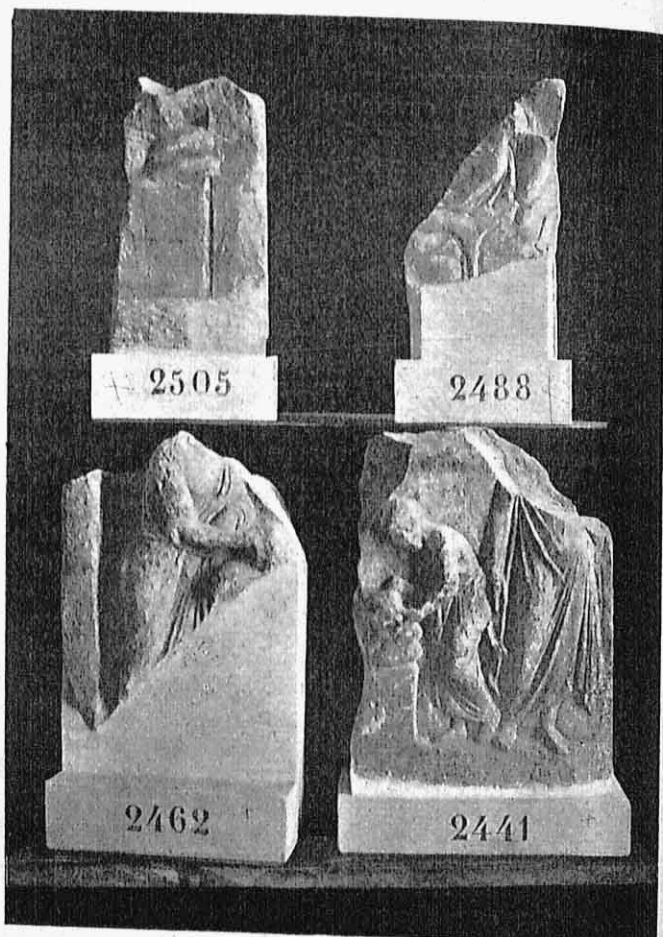
Εικ. 9. — Γ'Αναθηματικά ανάγλυφα ἐκ τοῦ Ἴ�σκληπείου Ἀθηνῶν.