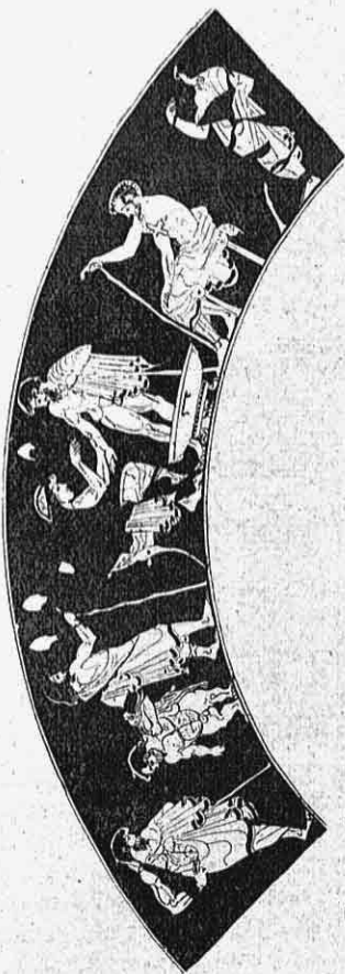
Εἰκ. 5. — Ἡ περὶ τὴν κοιλίαν τοῦ ἀρυβάλλου τῆς εἰκ. 4 ἐκτετατομένη παραστάσις ἰατρείου.

Ἐπτά εἶνε τὰ ἐπὶ τῆς κοιλίας εἰκονιζόμενα πρόσωπα: Ἐν τῷ μέσῳ νεαρὸς ἰατρός, ἄρτι γενειῶν, καθήμενος ἐπὶ θρόνου μετ' ἀνακλίσεως, φορῶν ἱμάτιον, περὶ δὲ τὴν κόμην ἐρυθρὸν διάδημα, λαμβάνει διὰ τῆς ἀριστερᾶς αὐτοῦ τὸν δεξιὸν βραχίονα ἀνδρὸς καὶ διὰ τῆς δεξιᾶς τεντώνει μετὰ προσοχῆς ἐκδήλου ἐπίδεσμον, οὗ τὸ λευκὸν χρῶμα κατέλιπεν ἴχνη, μὴ