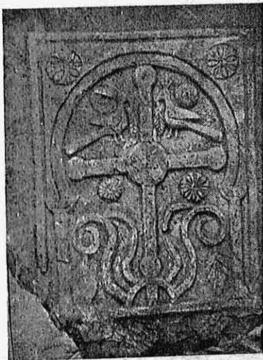
Ἡ σταυροφόρος πλάξ.

Ἡ πλάξ ἔχουσα πλάτος μὲν 0,70, ὕψος 0,90 καὶ πάχος 0,25 φέρει ἐντὸς τετραγώνου γλυπτοῦ πλαισίου, οὗ τὰς δύο ἄνω ἐσωτερικὰς γωνίας κοσμοῦσι δύο ρόδακες, σταυρὸν φέροντα κατὰ μὲν τὸ κέντρον μέγαν δίσκον, κατὰ δὲ τὰ τέσσαρα ἄκρα τῶν ἀκτί-