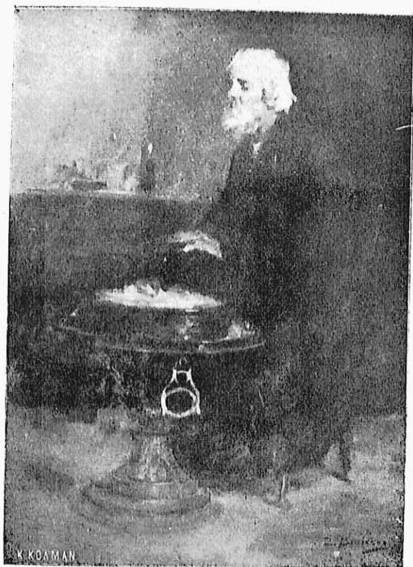
ΚΟΝΤΑ ΣΤΟ ΜΑΓΓΑΛΙ