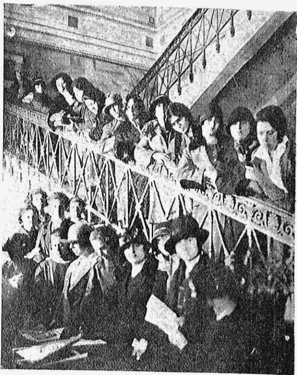
Πρῶτα γραφεῖα τῆς Χ. Ε. Ν. εἰς τὰ Π. Ἀνάκτορα.

Ἄλλα ἀποτελέσματα τῆς ἐργασίας τῆς Ἐνώσεως βαθυτέρα, ἂν καὶ ὀλιγώτερο χειροπιαστά, εἶνε ἡ μεταβολή, ποὺ γίνεται σιγὰ σιγὰ στὴν ψυχὴ τῶν κοριτσιῶν. Ἀρχίζουν νὰ