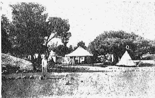
Ἡ Χ. Ε. Ν. κατασηνωμένη στὴν ἀκροθαλασσιά.

κοντὰ στὴν ἀκροθαλασσιά, κάτω ἀπὸ μεγάλα καὶ πλατύσκια πεῦκα. Πέρυσι καὶ ἐφέτος ἔστησε σκηνὲς μέσα στὸ δάσος τῆς Βουλιαγμένης κοντὰ στὸ ἐκκλησιαστικὸ ὄρφανοτροφεῖο. Καὶ ἐπειδὴ ἡ διασκέδαση εἶνε ἀπὸ τὶς κύριες ἀνάγκες τῆς νεότητος, γιὰ τοῦτο διοργανώνει καθ' ἑβδομάδα μικρὲς συναθροίσεις γιὰ τὶς νέες, δίδει συναυλίαι καὶ ἐτοιμάζει χριστουγεννιάτικο δένδρο. Καὶ κάθε μῆνα ὁ Κινηματογράφος