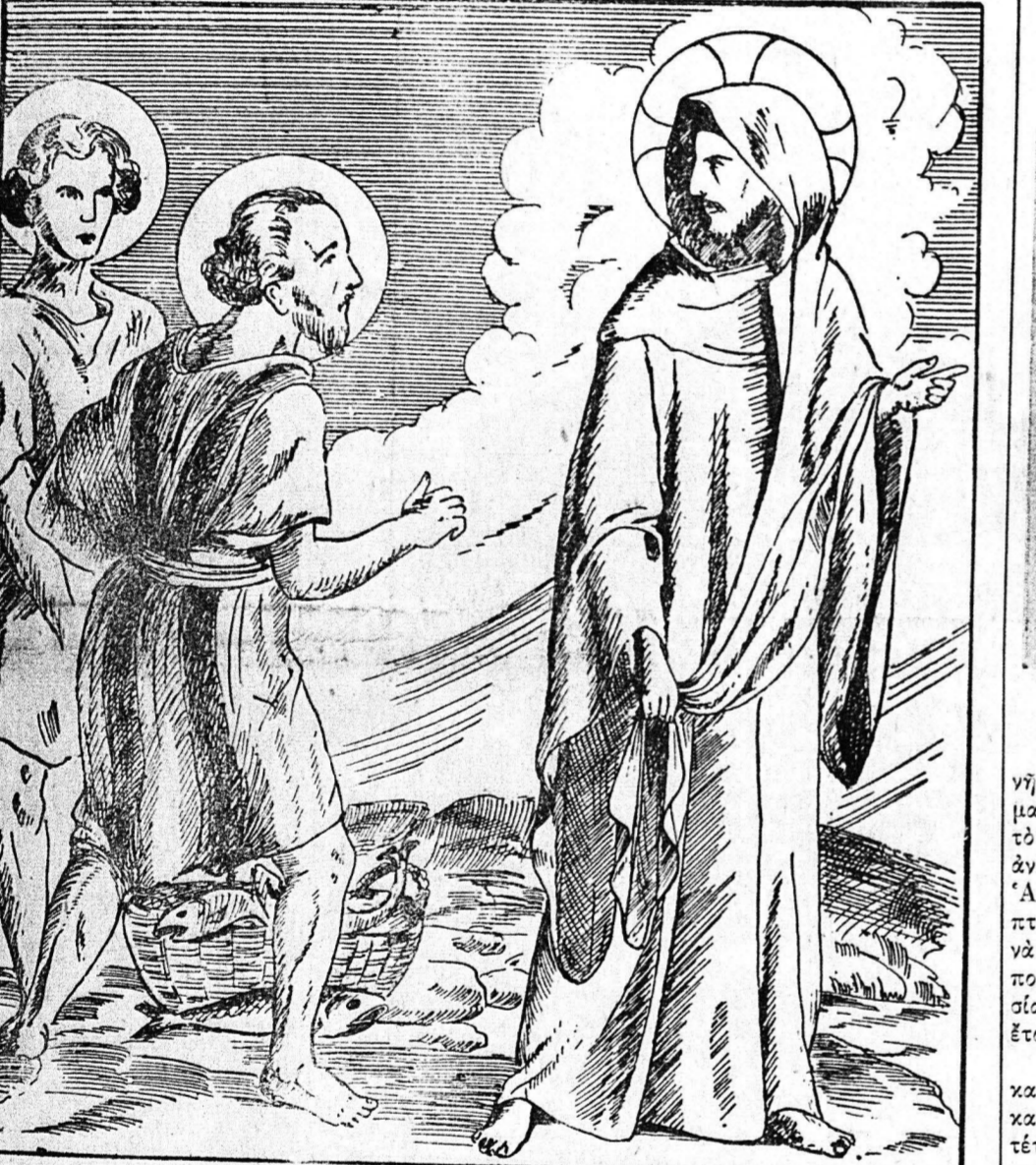
Ο Άποστόλος Άνδρέας, ακολουθών τον Ιησούν, διά να γίνη «άλιεύς ανθρώπων»