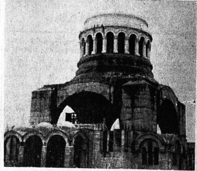
Χθесινή φωτογραφία του υπό ανέγειρον Ναού