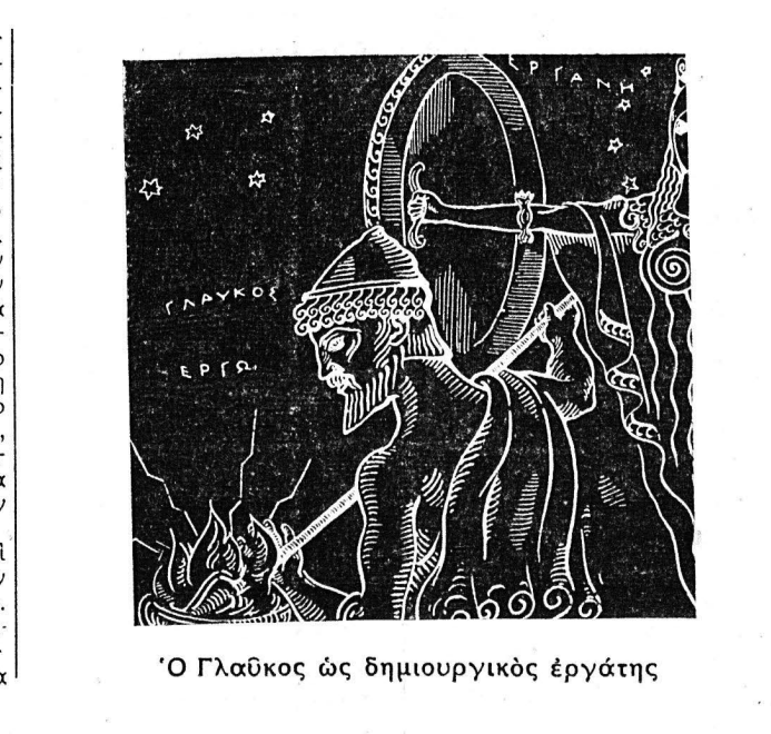
Ο Γλαύκος ως δημιουργικός εργάτης

Θνητός γεννήθηκε, κατά τόν μύθο, στην Άνθρόνα τής Βοιωτίας, παράλια πόλη επέναντι από τήν Εύβοια. Φωτός φαρός περνούσε τή ζωή του με καθήκον μύθο και άνεκλήρωτες έλπίδες. Μία μέρα που έκάμωσε σ' ένα λιβάδι να έκκουραστή, παρατήρησε ότι ένα από τά φύλλα που έβγαζε, μόλις άγγιζε τήν χλόη πάνω στην όποια ήταν έπιλωμένος, άναζωογονή-