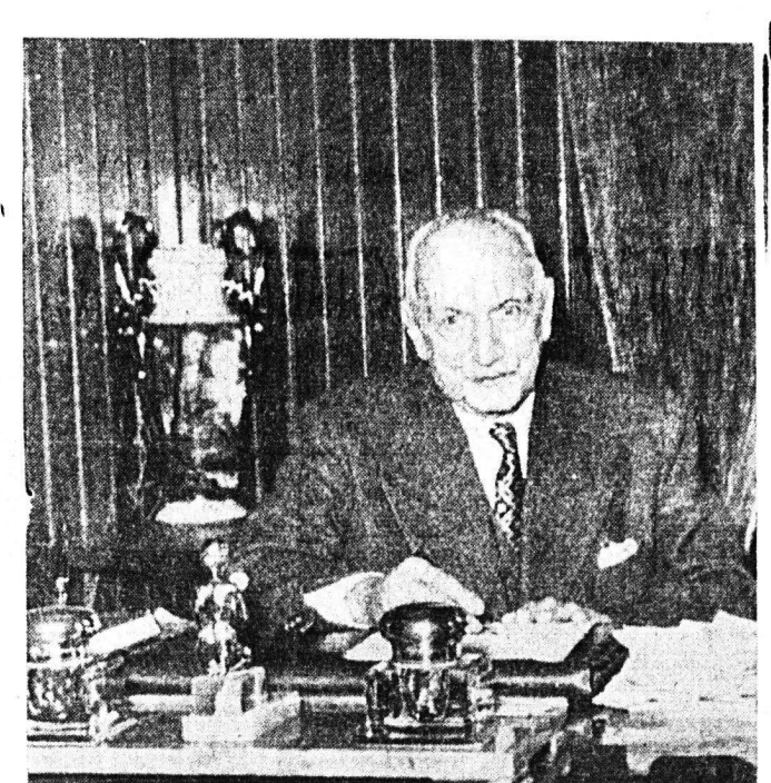
Ο δήμαρχος Πατρών κ. ΒΑΣ. ΡΟΥΦΟΣ

Δημοσίας Έπιχειρήσεως Ηλεκτρισμού εις τήν ήπειρωτικήν Ελλάδα, που έχει από 1ης παρελθόντος Αυγούστου υπό τήν δικαιοδοσίαν της. Αμφοτέροι, λοιπόν, αί Έταιρία διδών εξετάσεις, αί ή κολοσσία ΔΕΗ και ή μικρός μέν τό δέκος, αλλά μη χητής «Γλαύκος». Άλλως τε, ή έπιφύλαξις τήν όποιαν έκράτουν οι εκπρόσωποι τής πόλεως εν τώ ζήτημα τής άμέσου ενσωματώσεως του «Γλαύκου» εις τήν ΔΕΗ, α ύ τ ό τό νόημα είχε. Δέν ήτο, άπλως, ένα ζήτημα γούτρου, τό να μη απορροφήθώ δηλ. ο «Γλαύκος» όμοι μετά τών άσημάτων έταιριών τών έπαιρητών. Ητο ένα αίτημα ούσιαστικόν, όπως έταίρηθ ή ίδιή μας άφώγει οργανωμένη και υποδειγματικώς λειτουργούσα έταιρία από τό αναληφθέν π ε ι ρ α μ α, δεδομένου, άλλως τε, ότι τά τιμολόγια τών Πατρών ήσαν ευθηνότερα. Η έπιφύλαξις ήτο περιορισμένη εις χρόνον: Όταν — και έάν — περιήρχετο και ή Πάουερ εις τήν ΔΕΗ, τότε θα περιήρχετο και ο «Γλαύκος». Τήν κοινήν τύχην επί έθνικου επιπέδου δέν θα ήδύνατο να τήν άποκρούσωμεν. Απεκρούσαμεν, όμως, τήν κοινήν τύχην επί έπιτεύματι, προς διασφάλισιν τών ούσιαστικών συμφερόντων τής πόλεως.