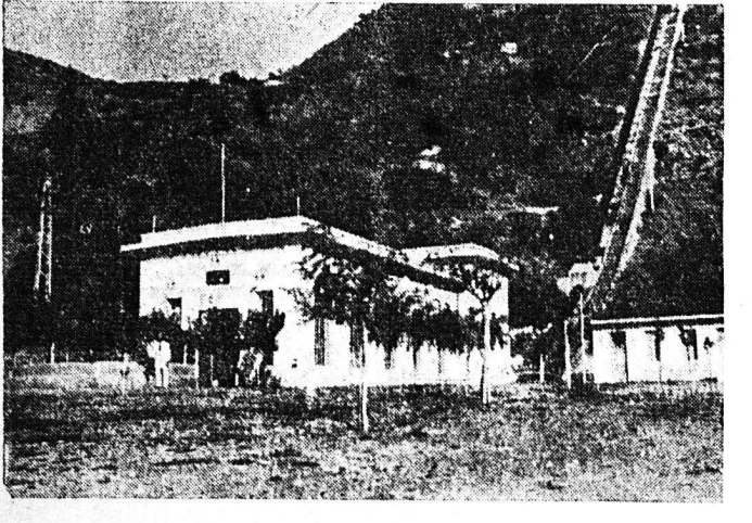
Εξωτερική άποψις του υδραυλικού εργοστασίου

ΣΥΝΕΧΕΙΑ ΕΚ ΤΗΣ 3ης ΣΕΛΙΔΟΣ νοική, διά των υπό κατασκευήν συμπληρωματικών έργων. Δεν ήτο ανθρώπινως δυνατόν να γίνουν όλα διά μιάς. Ήδη όμως βαίνουμε προοδευτικώς και πιστεύω ότι τουτό είναι γενικώς αντιληπτόν. Ο «Γλαύκος» είχε πάντοτε την άριστην φήμην επί κεφαλής όλων των επαρχιακών πόλεων. Την φήμην αυτήν διατηρούμεν και ενισχύομεν, με την αγάπη του λαού των Πατρών. Θά πρέπει να ληφθή ύψιμ—συνέχισεν ο κ. Δήμαρχος, ότι ο «Γλαύκος» αντιμετωπίζει, μίαν ραγδαίως