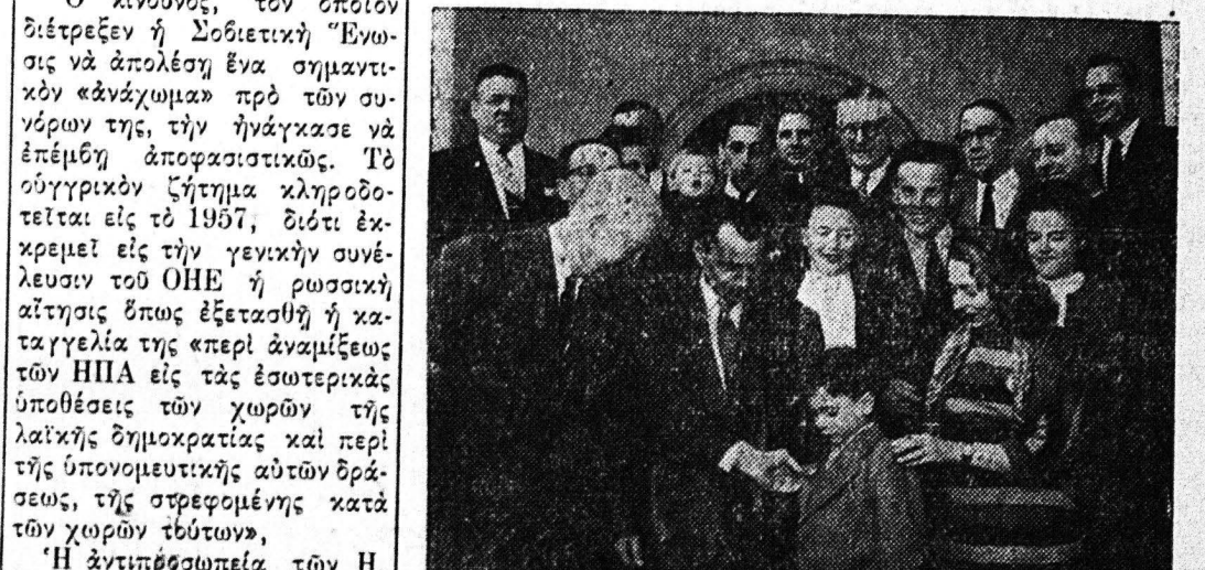
Η ΟΥΓΓΡΙΚΗ ΕΠΑΝΑΣΤΑΣΙΣ

Χαρακτηριστικό σκίτσο αμερικανικής έφημερίδος διά τήν άποσταλινοποίησην οί μεγαλύτεροι παρατηρητάί των έσωτερικών γεγονότων. Η αισιόδοξος αυτή πρόβλεψις στηρίζεται, δέδωκα, είς τά δεδομένα τού λήξαντος έτους, τò όποιον, κατά τούς τελευταίους μήνας, έγνώρισεν τήν μεγαλύτεραν διεθνή κρίσιν με τά γεγονότα τής Κεντρικής Εύρώπης και τής Μέσης Ανατολής. Τά γεγονότα ήπείδισαν ότι οί δύο μεγάλοι συνασπισμοί—ή Σοβιετική Ένωσις και ή 'Ηνωμένη Πολιτεία—δέν έπιθυμούν να φέρουν είς πόλεμον διά τήν επίλυσιν τού θέματος τής ήγέσις τού κόσμου, τò όποιον τίθεται και από τά δύο μέρη και κατά διάφορον τρόπον. Η Μόσχα έπραξε τò πόν διά να μήν έλθη είς σύγκρουσιν με τήν 'Αμερικήν και ή 'Αιζενχάουερ δέν έδίστασε να ταπεινώση τούς καλύτερους συμμάχους τού, Άγγλους και Άλλούς, προκειμένου να έντοπίση τήν ρήσιν είς τήν Αίγυπτον και να άποτρέψη τήν άποστολήν Ρώσων ενήθεν έθελοντών, πράγμα τò όποιον θά ήτο δυνατόν ν' άποθή μοιραστον διά τήν παγκόσμιον ειρήνην.