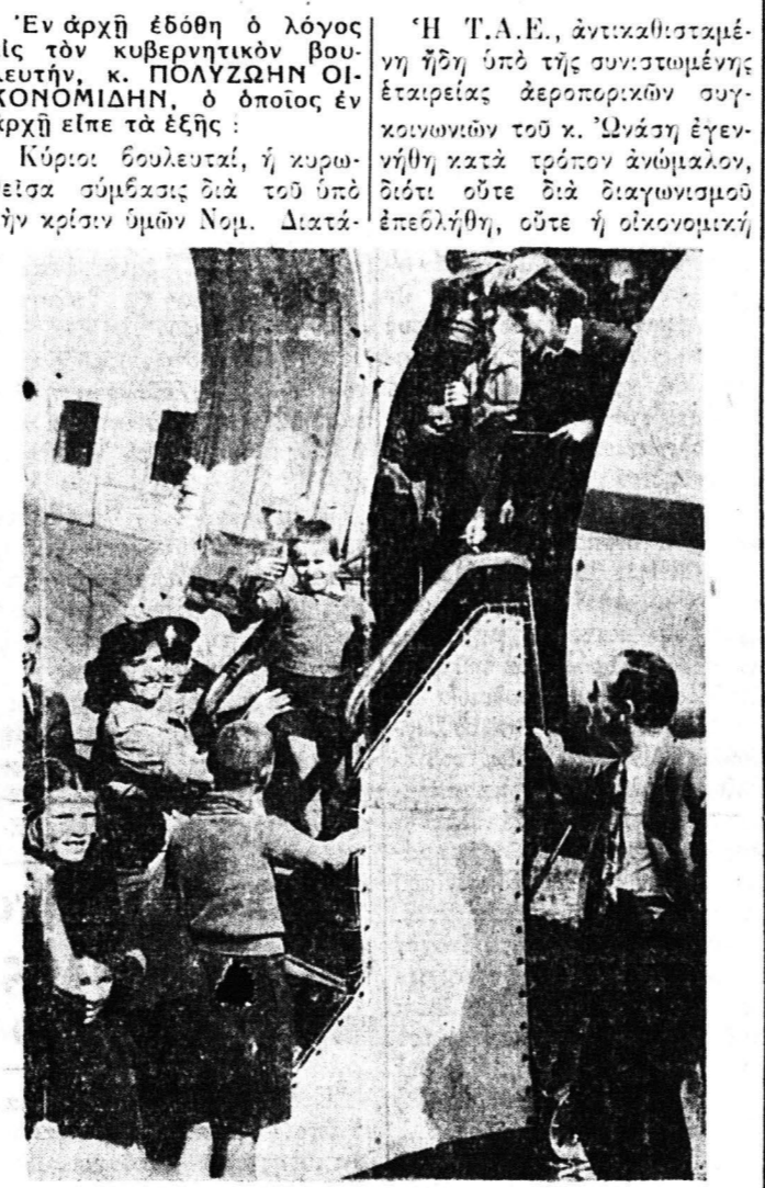
Από τήν δράσιν της ΤΑΕ: Μεταφορά όρφανών παιδιών τού άνταρτοπολέμου εις Έξβετιαν

της συγκρότησε ειδικολόγει τήν εις αυτήν άνάθεσιν τών αεροπορικών συγκοινωνιών. "Η το μία άφανής 'Εταιρεία με κεφάλαιον προπολεμικώς 5.000 δολλαρίων της όποιας μετείρα πολύ ακριβά εις τό Κράτος, με την διαρκή άραισίαν του προϋπολογισμού, χωρίς παρά ταύτα να καταστή δυνατόν να σταθί εις τά πόδια της ή Τ.Α.Ε. άποτυχούσα παταγώδως κατά γενικήν άναγνωρίσιν και 2ον. "Οτι Έλληνας παγκοσμίου οικονομικής δραστηριότητος εκδηλώνει ενδιαφέρον διά την Έλληνικήν οικονομίαν.