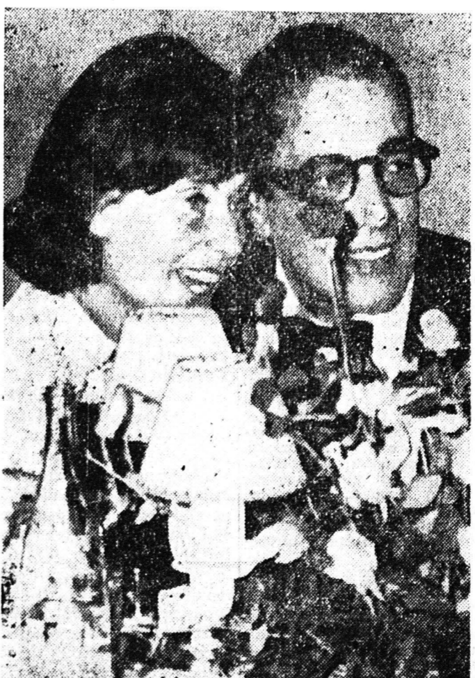
Ο 'Ωνάσης εις ένα «σπήν του σπήν» με τήν Γκρέτα Γκάρμπο. Η φωτογραφία ελήθη, χωρίς οι ένδιαφερόμενοι να τό αντίληφθωσιν, εις τό Σπόρτινγκ Κλάμπ του Μόντε Κάρλο

αγεται. Συγκεκριμένως άναφέρεται ότι εις τήν σύμβασιν του συναφθέντος άναείου, όπερ έτέλεσε υπό τήν έγγύησιν του Κράτους, προεβλέπετο ΠΙΟΧΡΕΣΙΣ τής Κυβερνή-