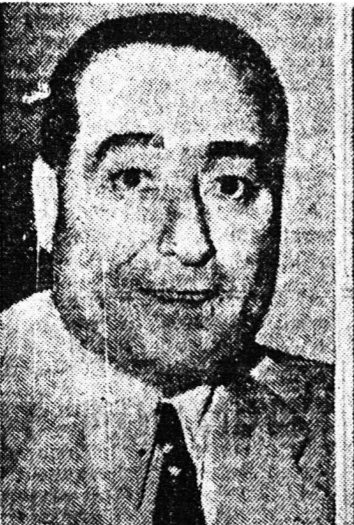
ΜΟΥΧΑΜΕΤ ΡΙΖΑ ΠΑΧΛΕΒΗ Σάχης τῆς Περσίας Υἱὸς τοῦ δεσποτικοῦ Ριζά Χάν Παχλεβή κολούθησαν ὄδον ἐντελέξαι ἀντίθετον ἐκείνης τοῦ πατρὸς του.