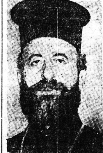
ΑΡΧΙΕΠΙΣΚΟΠΟΣ ΜΑΚΑΡΙΟΣ Ἡγέτης τῶν Κυπρίων Ἡλικίας 43 ἐτῶν παρέμεινε ἐπὶ 110 ἡμέρας ἠοραιοεὐαριστὸν ἐπὶ τῶν ἡμερῶν τῆς Ἐκκλησίας τοῦ 1946.