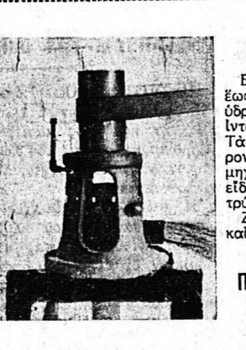
ΚΑΤΑΣΚΕΥΑΖΟΝΤΑΙ ΠΟΜΟΝΕΣ Βαθῶν φρεσῶν ἀπὸ πέντε ἐως δέκα ἰντσῶν ἰντσῶν, ἀπόδοσις ὑπερβατικῆς ἀπὸ τριῶν ἰντσῶν μέχρι πέντε ἰντσῶν...