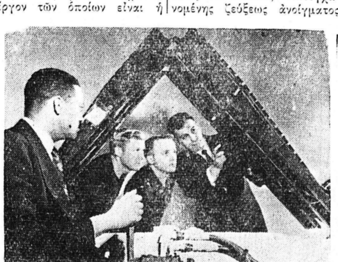
Αξιοματικοί του μηχανικοῦ του ἀμερικανικοῦ στρατοῦ...