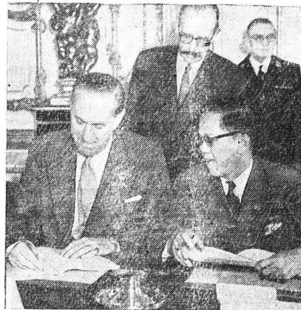
Τελευταίως ἡ Συντακτικὴ Συνέλευσις τῆς Σιγκαπούρης ἀπέφασεν ὅπως ἡ χώρα ἀποκτήσῃ...