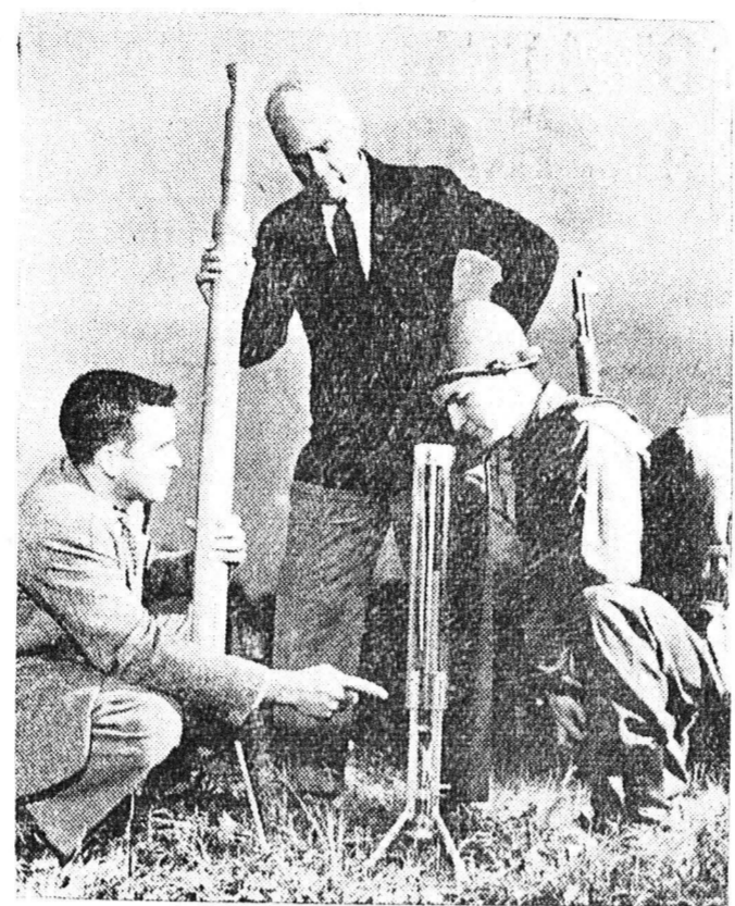
Πειραματικοί έξκαφερις δοκιμάζονται υπό Αμερικανών τεχνικών...