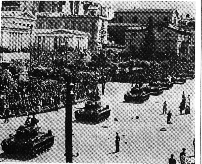
Είς την φωτογραφίαν τελευταίου τύπου αμερικανικά όργανα μάχης, που έδωσαν είς την Ελλάδα βάσει του προγράμματος...