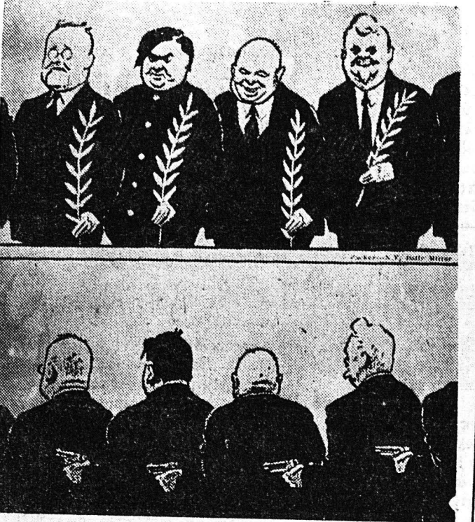
Μία ἀμερικανικὴ ἐφημερίς εἶχε πρό μηνῶν παρουσιάσει τοὺς σοβιετικὸς ἡγέτας...