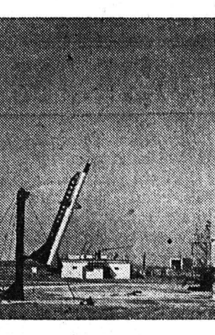
Ρουκέτα που εκτοξεύεται από τον σταθμό ερευνών...