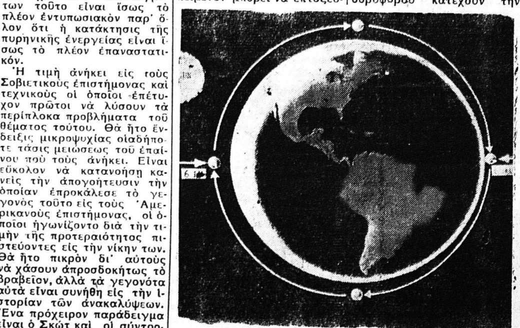
Ένας τεχνητός δορυφόρος εις απόστασιν 250.000 μιλίων από τής γής συμπληρώνει μίαν περιστροφήν περί αυτής εις 90 λεπτά τής ώρας. Το άνωτερον σχεδιάσμα έλήφθη από το άμερικανικόν περιοδικόν «Λαϊκή Έπιστήμη»

Η έπιτυχής εκτόξευσις υπό των Ρώσων δύο τεχνητών δορυφόρων τής γής έγοήτευσε την φαντασίαν όλοκληρου του κόσμου. Εις μάσην έποχήν έντυπωσικόν έπιστημονικόν έπιτευγμάτων τοϋτο είναι ίσως το πλέον έντυπωσικόν παρ' όσον ότι ή κατάκτησις τής πυρηνικής ενεργείας είναι ίσως το πλέον έπανάστατικόν.