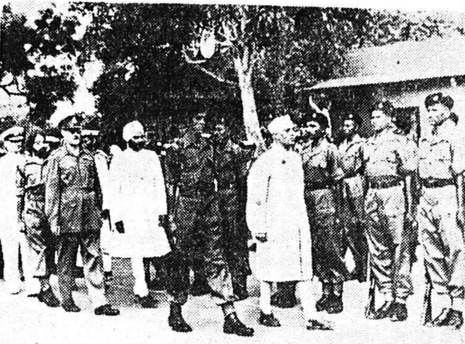
10. ΙΝΔΙΑΙ: Ο πρωθυπουργός Νεχρού έπιθεωρεί στρατεύματα, έν Βομβάη επί τής επέτειώ τής 40ής τής ανεξαρτησίας τής 15ης Αυγούστου 1957. Την 26ην Νοεμβρίου 1949 έψηφίσθη το σύνταγμα και από τής 26ης Ιανουαρίου 1950 αι Ινδίαί άνεκράχηθησαν άνεξάρτητος δημοκρατία μέσα εις τά πλαίσια τής Βρετανικής Κοινοπολιτείας