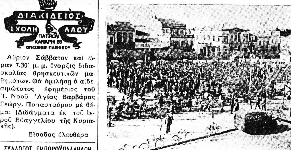
Την παρελθούσαν Κυριακήν εις την πλατείαν Γεωργίου έπαίει ή πάντα του άμερικανικού άεροπλανοφόρου «Ράντολφ», το όποιον την Τρίτην απέλυσεν εκ του λιμένος μας. Πλήθος κόσμου παρηκολούθησε την συναυλιαν και έχειροκρότησε την όρχηστραν

Αύριον Σάββατον και ώραν 7.30 μ.μ. έναρξις διδασκαλίας θρησκευτικόν μαθημάτων. Θα όμιλήση ο αιδεσιμώτατος εφημέριος του Ι. Ναού Άγίας Βαρβάρας Γεώργ. Παπασταύρου με θέμα: (Διδάγματα εκ του Ιερού Ευαγγελίου της Κυριακής).