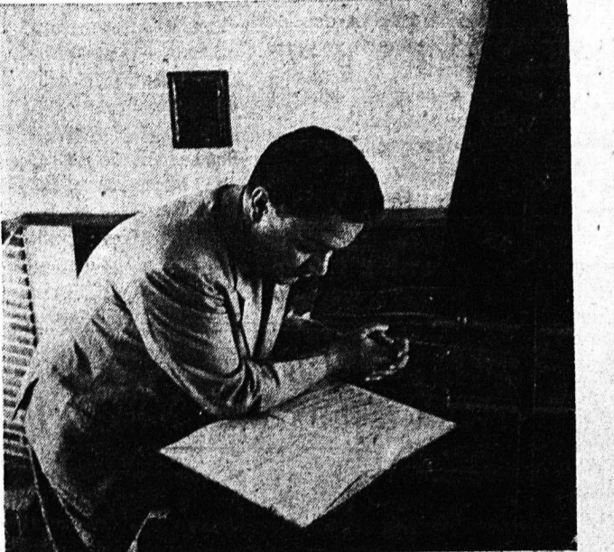
Ο μουσικόςσυνθέτης κ. ΜΑΝΟΣ ΧΑΤΖΙΔΑΚΙΣ