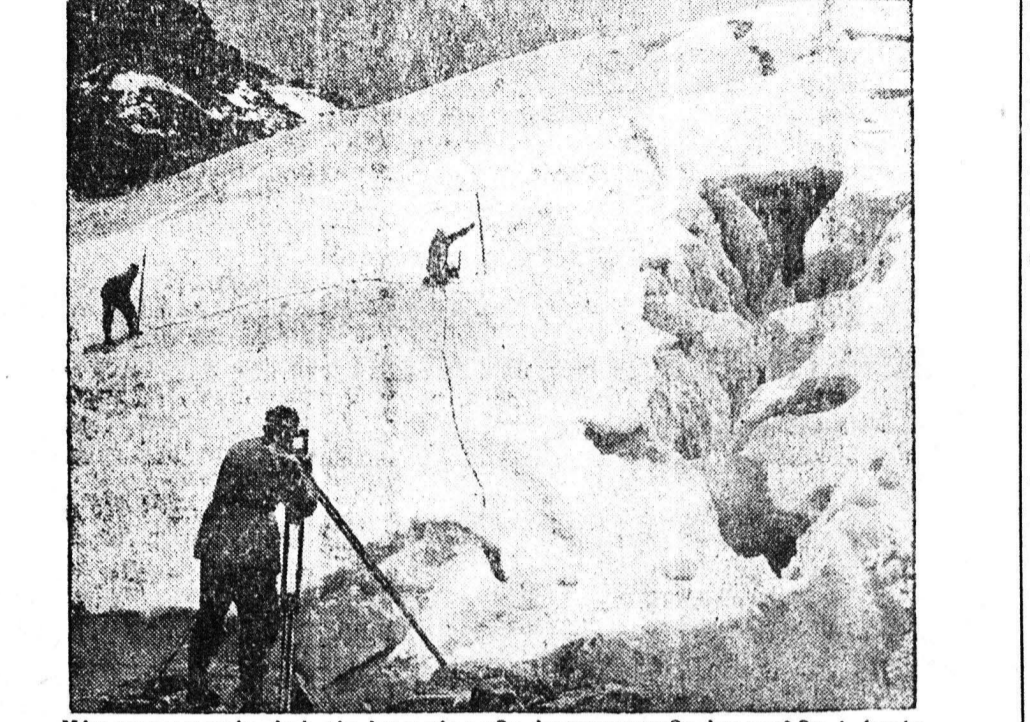
Μια φωτογραφία από τὰς έργασίας τής επιστημονικής αποστολής ή όποις εις τὰ πλαίσια του Διεθνούς Γεωφυσικού Έτους εκτελεί διάφορους παρατηρήσεις επί του όρους Κένυα τής τροπικής 'Αφρικής

Αί έρευναί αυτάί είναι ή συμβολή τής Κένυα εις τόν Διεθνή Γεωφυσικόν Έτος. Παράλληλος πρὸς τόν κύριον πρόγραμμα των, δηλαδή τήν μελέτην των δώδεκα ή και περισσοτέρων παγετώνων των προσολλημένων εις τούς απότομους κρημνούς του όρους Κένυα, έκαμαν και μελέτας σχετικές με τήν μετεωρολογία, τήν βιολογία, τήν γεωλογία, τήν κλιματολογία και τήν υδρολογία. Διά τὰ εξετασέν τήν συμπεριφοράν των παγετώνων, που όλοι εύρισκονται έπάνω από τὰ 4.570 μέτρα, οι επιστήμονες έγκαιροτάστασαν εις μίαν καλύβαν πλησίον των Παγετώνων Λιούτις εις ύψος 4.875 περίπου μέτρων από τήν επιφάνειαν τής θαλάσσης και άκριβώς κάτω από τὰς δύο μεγαλύτερας κορυφάς Μπατίαν και Νιλιάν, που είναι αι ύψηλότεραι του όρους Κένυα. Έπί επτά εβδομάδας ή καλύτερα αυτή ή τώ ό ύψηλότερος συνοικισμός τής 'Ανατολικής 'Αφρικής με πληθυσμόν 4 όποιοι εκμύκνουν μεταξύ έξη και δεκαεπτά άτόμων.