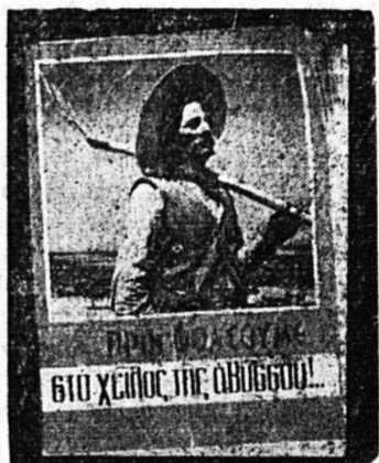
Ένα διδύλιον πού πρέπει να διασώσθ από όλους μαθητάι προμηθευθήτε τον «ΟΔΗΓΟΝ ΓΙΑ ΝΑ ΕΠΙΤΥΧΕΤΕ ΣΤΟ ΓΥΜΝΑΣΙΟ»

ΟΓΑΣΙΓΚΤΩΝ. Τό «Αμερικανικόν ναυτικόν άπεράσει τήν μαζικήν παραγωγήν τού τηλεκατευθυνόμενου βλήματος «Ρέγκουλος II». Τό βλήμα αυτό προσέρχεται διά τά ύποβρυχία και έχει βεληνές 1600 χιλιομέτρων και πλέον.