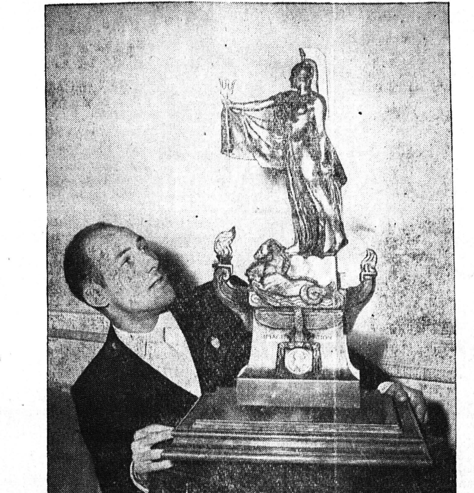
Τό έφετειόν βραβείον διεθνών μεταφορών, άπονεμόμενον εις μνήμην του σέρ Χένρυ Σηγκραϊφ, άπενεμήθη εις τόν Στέρλιγκ Μόρς, τόν διάσημον οδηγόν αυτοκινήτου, ο όποιος εκέρδησε τά «Γκραν Πριξ της Άγγλιας, της Ιταλίας και της Πεσκάρας. Τό βραβείον άπονεμεται εις τούς συντελεστας εις την πρόβον των μεταφορών χερσαίως, έναερίως και θαλασσίως