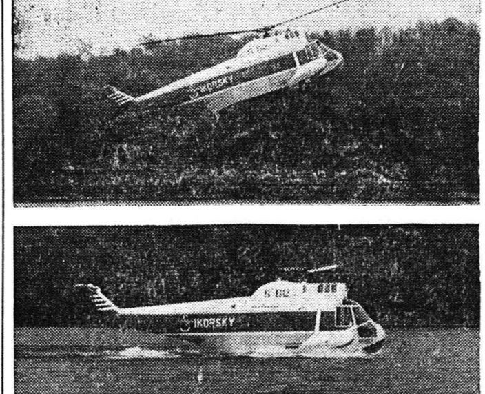
Τό πρώτο άμφιβιον ελικόπτερον του κόσμου άπογειούται (άνω) και προσθαλασσώνεται (κάτω)