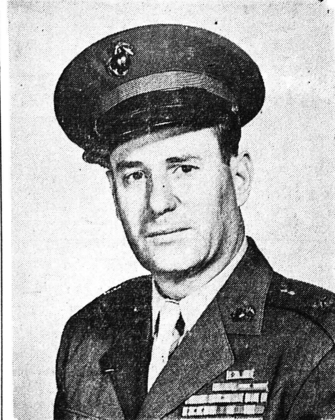
Ο ύποστράτηγος Σίνιτζ Γουσίτζ, άρχηγός του Σώματос Πεζοναυτών που σταθμεύει εις τόν Λίβανον