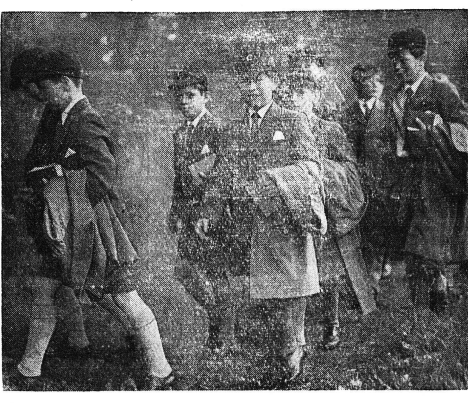
Ο διάδοχος της Αγγλίας πρίγκηψ Κάρολος (εις τὸ κέντρον) εις τὸν ὅποιον τελευταίως ἡ Βασίλισσα ἀπένευε τὸν τίτλον του πρίγκηπος τῆς Οὐαλίας...