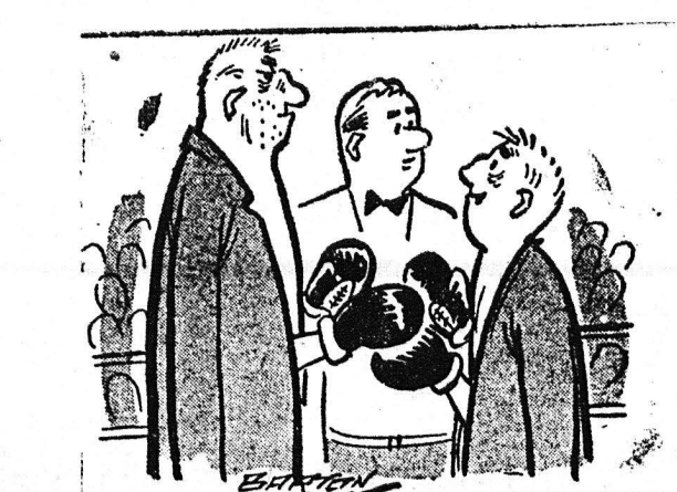
—Δὲν εἶναι καλλίτερα νὰ καταφύγουμε σὲ διαίτησι;

διὰ τὴν διαχείρισιν τῶν γεωργι- κῶν ἐφοδίων ὑπὸ τῆς ΑΤΕ, οἱ Σταθμικοὶ Δείκτες τῆς ΑΤΕ καὶ ἐνδιαφερόμενα εἰδησίως διὰ τὴν ἀγροτικὴν πλίσιν καὶ τὴν συνε- ταριστικὴν κίνησιν.