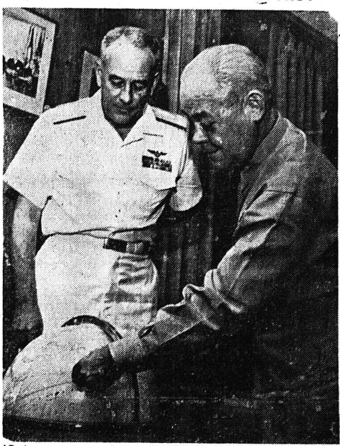
Ο ύποναύαρχος Φρέντερικ Κιρέτ (άριστερα) μεταβαί- νων να αναλάβη την διοίκησιν του άμερικανικού 7ου στόλου της 'Απω 'Ανατολής, έσταμάτησε εις Πέρλ Χάρμπορ της Χαβάι και συνοεσκέθη με τον ναύαρχον Χέρμπερτ Κόπγουντ, διοικητήν του στόλου του Ειρηνικού