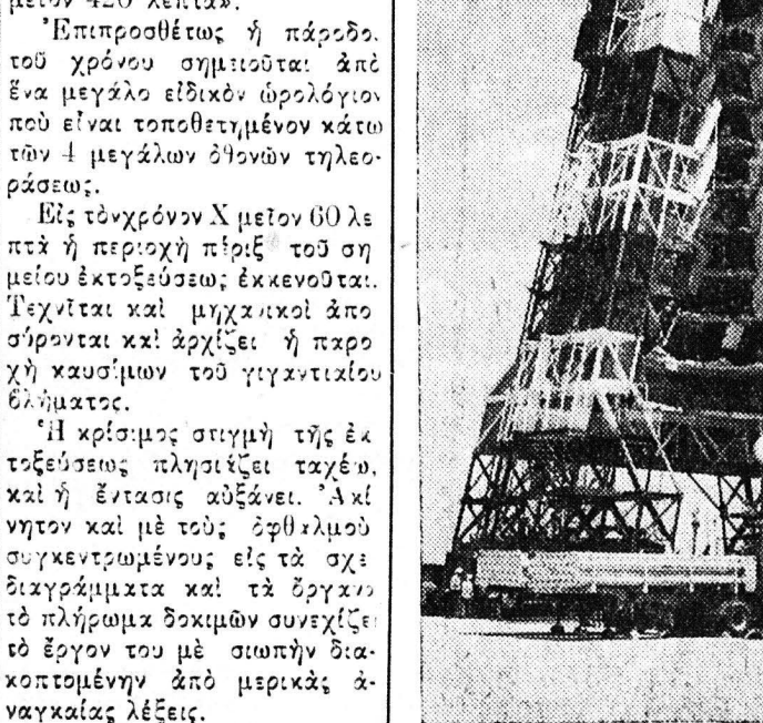
Τό βλήμα απομακρύνεται από τό βλήμα «Ατλας» εντός όλλου τό «Ατλας» θα εκτόξευθη εις τό διάστημα

Τό βλήμα «Ατλας» έχει μήκος 25,9 μέτρα και ζυγίζει 100 τόνους, τό βεληνές του διαβάνει τα 9.600 χιλιόμετρα. Αναπτύσσει ταχύτητα 24.000 χιλιόμετρον την ώραν και τό σύστημα προώθησεως