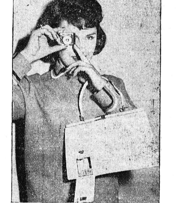
Εις τήν Έκθεσιν Βιομηχανιών δερματινών ειδών τού Λονδίνου...