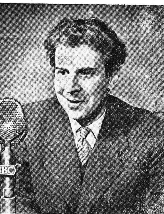
Ο γνωστός Έλληνας μουσικοσυνθέτης κ. Μίκης Θεοδωράκης...