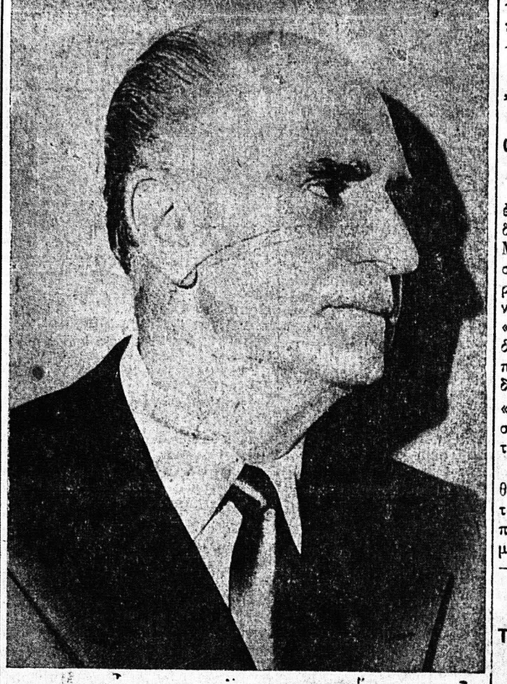
Ὁ κ. Γεώργιος Παπανδρέου