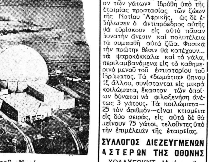
Ἀεροπορικὴ ἀποψις τοῦ «Ντρεσέντον»

Ὁ ατομικίνητον ἐργοστάσιον πού εἶναι τὸ μεγαλύτερον τοῦ εἴδους ὅσον πρὸς τὴν Ἀμερικὴν, θὰ εἶναι ἐτοιμὸν ἀγορευτικῶς περὶ τῆς πολιτείας Ἰλλινόις.