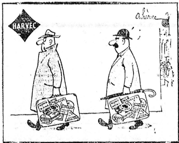
—Υπαποτιέομαι ότι με παρακολουθούν!

Σχολή ασφών, πλυτήριον αδοκίμητων. Κολοκοτρώνη 34. Γκαράς.