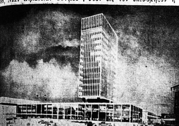
Το Τελεσίγραφο του Μπίρμινγκχαμ... Η ανέγερση συνεχίζεται και υπολογίζεται να περατωθεί εντός του 1964.

ΑΓΓΛΙΚΟΣ τύπος εισέρχεται εις την πρώτην εν όλων εφ' όλης της έκτασης κυκλοφορίας εν συγκρίσει προς τον πληθυσμόν. Κατά τους δύο πρώτους μήνες του 1963... Η ανέγερση συνεχίζεται και υπολογίζεται να περατωθεί εντός του 1964.