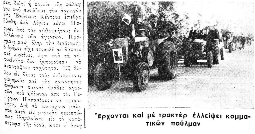
Έρχονται και με τρακτέρ έλλειψις κομματικών πούλιαν