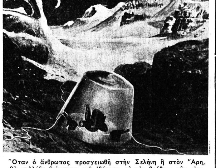
Όταν ο άνθρωπος προσεγγισθί στην Σελήνη...