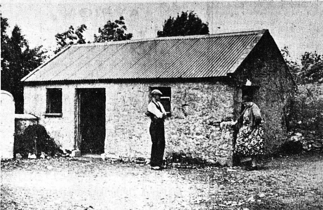
Τὸ παλιὸ προγονικὸ σπίτι τῶν Κέννεντυ ἐπὶ τὴν Ἴρλανδίαν. Ὁ μακρῶν ἐξεδέφω τοῦ Προέδρου καὶ ἡ ἀδελφὴ τοῦ (ἡ ὁποία ἐπιμαρτυρεῖ τὴν ἀπόστασιν ἑνὸς ἀκρωγιαίου λίθου, νὰ τὸν προσφθέρῃ ἐπὶ τὸν Τζῶν Κέννεντυ ὅσον κειμήλιον τοῦ σπιτιοῦ τοῦ προ- προπάπου του)

ΜΙΑ ἡμέρα τοῦ 1947, ἑνὸς συνσταταμένου νέου ἔκρουε τὴν θύρα μίαν ἀγροικίαν τὸν Ντῶν Κέννεντυ, τῆς Ἴρλανδίας. «Εἶμαι ὁ Τζῶν Κέννεντυ ἀπὸ τῆς Βοστώνης», εἶπε κατὰ πειστώ- σιν αὐτὸ εἶναι τὸ παλαιὸ σπιτικόν τοῦ Κέννεντυ, ἀπὸ ὅπου ἐ- κίνησε ὁ προ-προπάππος μου, τὸ 1848, γιὰ νὰ μετανάστευσῇ εἰς τὴν Ἰρλανδίαν Πολιτείας». Καὶ πραγματικῶς, ὁ ἀνδρῶν τοῦ 35ος Πρόεδρου τῶν Ἡνωμένων Πολιτειῶν, ὅπως τότε ἀπὸ μέλος τοῦ Κογκρέσσου, ἴστατο πρὸ τοῦ ταπεινοῦ οἴκηλου, τῆς γηραιᾶς ἑτέρας τῆς «φυλῆς» τῶν Κέννεντυ, ὅπου ἐξασκοῦσθετο νὰ κατοική- σῃ ἕνας ἀπόγονος, ὁ Τζαίημς Κέν- εντυ, μακρῶν τῶν ἐξεδέφω. Ἐκεῖ εἶχε γεννηθῆ καὶ ζῆσει ὁ γενάρχης, ὁ Πάτριος Ζοσεφ Κέννεντυ. Ἀναγκάσθηκα νὰ ἐκ- παρτηθῶ ἐπὶ τὴν Ἀμερικήν, ἐπειτα ἀπὸ τὴν «πένητα τῆς πατάτας» τοῦ 1840, πού ὄθησε πολλοὺς Ἴρλανδούς εἰς τὴν μετανάστευσιν. Ἐπίσης δουλεῖται εἰς τὴν Βοστώνην ὡς χειρῶν ἐργάτης. Καὶ οἱ δύο πρόγονοι τοῦ Τζῶν Κέννεντυ εἶχαν ἀνομιχθῆ ἐπὶ τὴν πολιτικὴν. Ὁ Πάτριος Κέννεντυ ἐλύθησε ἐπὶ τὴν πολιτικὴν, γιὰτὶ ἦταν πολὺ πρόσχαρος καὶ δημοφιλής. Ἀ- πὸ τὴν ἀρχὴν εἰσήθη ἐπὶ τὸν Δι- μοκρατικὸν κόμμα. Πρῶτον ἀνεδεί- χθη σύμβουλος τῆς ἀνατολικῆς Βοστώνης, ἐπειτα ἔγινε πολιτεία κὸς πολιτείας τῆς Μασαχουσέ- της καὶ ἐξελέγη εἰς τὸ τέλος ἐκ- πρωσποπος εἰς τὸ Κογκρέσσον. Ὅσο γιὰ τὸν Τόμας Φιτζε- ραλντ, ἐξελέγη δύο φορές δημο- κράτης τῆς Βοστώνης καὶ ἐπίσης