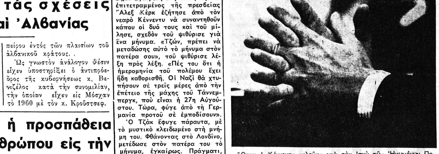
Όταν ο Κένεντυ μιλούσε τήν Ιαγύ τών 'Ηνωμένων Πολιτειών έστράωσε τή χέριαν του. Τό έγινε μία συνηθισμένη χαρακτηριστική χειρονομία...