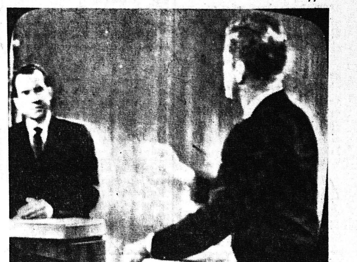
Ο Κένεντυ στην συντριπτική γιά τον Νίξον διαλογική συτήρησιν από την τηλεόραση