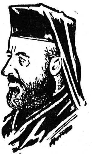
Έργον του μεσολαθητού εις την Κυπριακήν διένεξιν

Τον Σεπτέμβριον θα προσφύγη εις την συνέλευσιν του ΟΗΕ