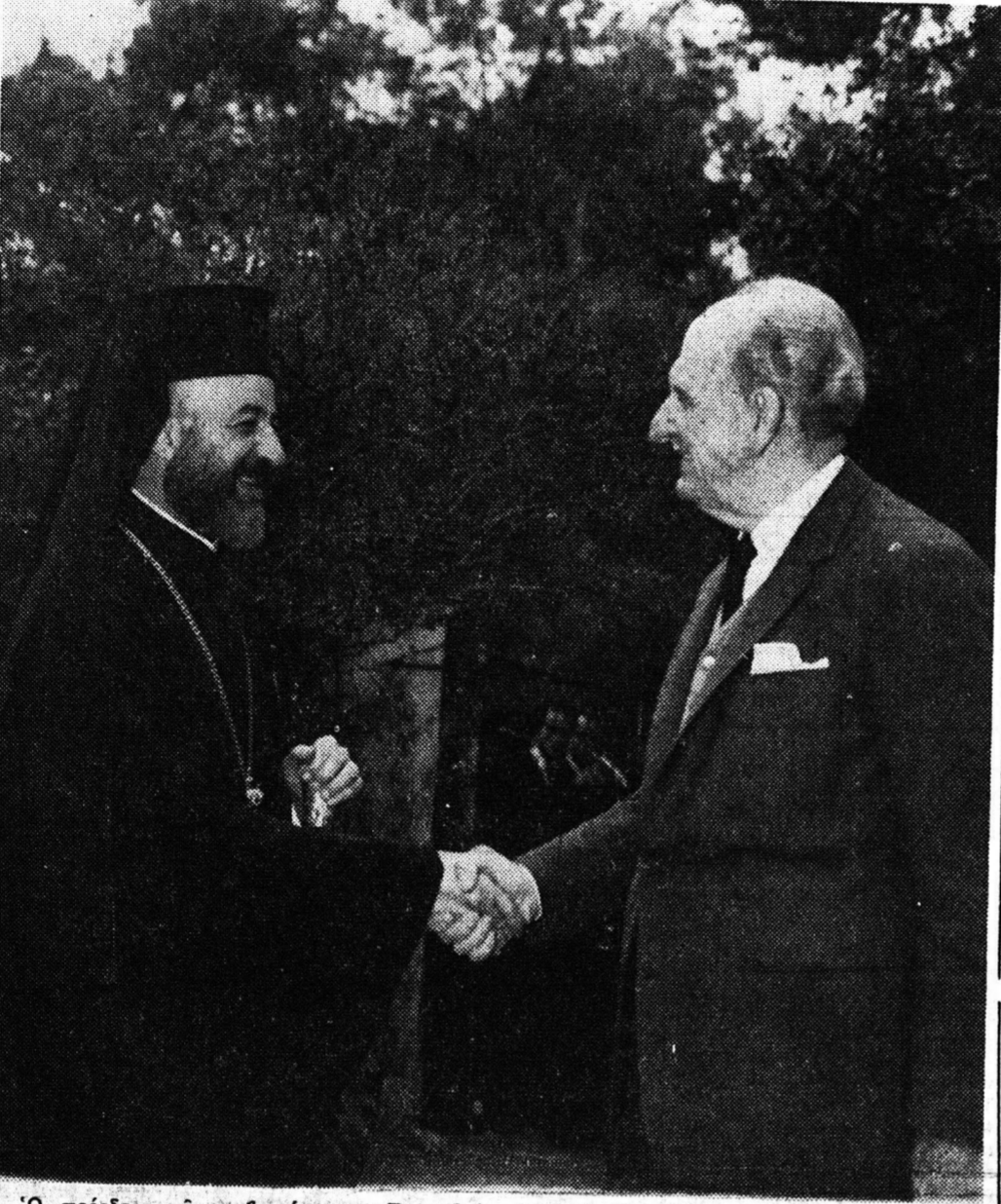
Ο πρόεδρος της κυβερνήσεως κ. Παπανδρέου υποδεχόμενος τον αρχιεπίσκοπον Μακάριον