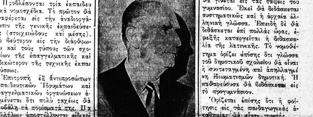
Ο κ. Παπανδρέου