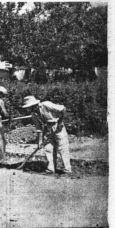
Συνεχῆς ὄργανισμός δρᾶσεως: Συνεργεῖον ἐπέκτασεως τοῦ ἀποχευτικοῦ δικτύου...

Ἐγένετο ἐπέκτασις τῆς ὁδοῦ Βουντένης — Μπάλλα καὶ ἀνακατασκευῆ τῆς ὑπὸ τῶν πλημμυρῶν καταστραφείσης γειώματι δρχ. 58.263.