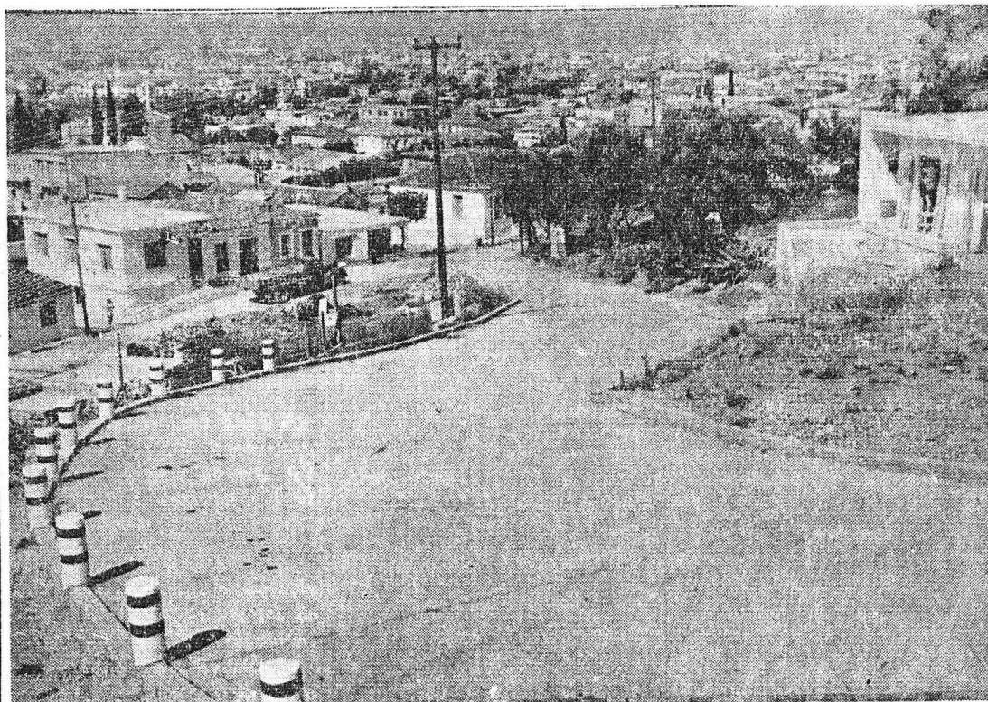
Δύο χαρακτηριστικαὶ ἀπόψεις ἀπὸ τῶν ἀναδημιουργικῶν ἔργων τοῦ Δήμου εἰς τὰς συνοικίας τῆς πόλεως: 1) Τμήμα...