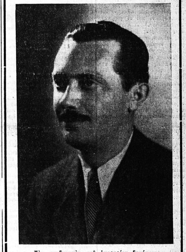
Τόν συνδυασμόν τού ύποψήφιου δημάρχου κ. Φαρμακίδη...